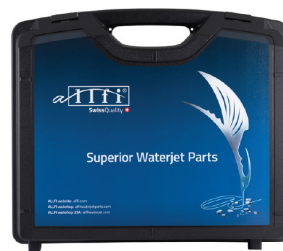
882100 - Werkzeugkoffer