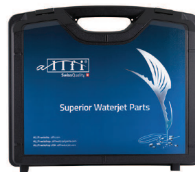
882101 - Werkzeugkoffer für Schneidkopf